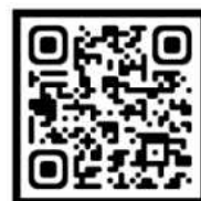
치과대학 30년사 PDF